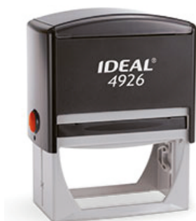
75x38 мм 1425 руб.