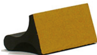
45x15 мм 400 руб.