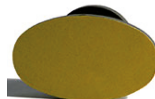
60x35 мм 600 руб.

Срок изготовления — 1 рабочий день с момента утверждения макета.