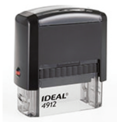
47x18 мм 900 руб.