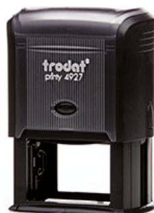
60x40 мм 1650 руб.