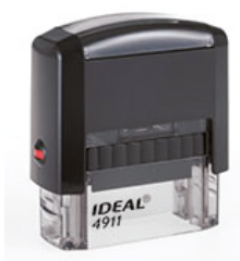
38x14 мм 825 руб.