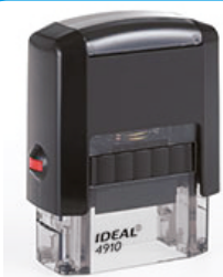
26x9 мм 825 руб.