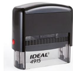
70x25 мм 1050 руб.