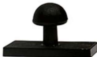
58x25 мм 375 руб.