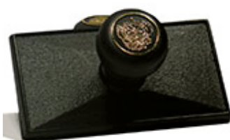
110x60 мм 1200 руб.