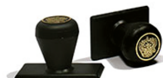
70x30 мм 525 руб.