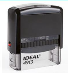
58x22 мм 975 руб.